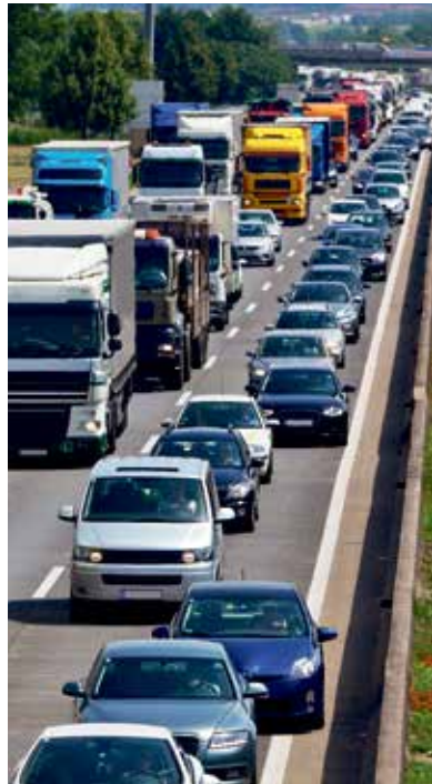
So ist keine Rettungsgasse und dadurch kein Durchkommen für die Rettungskräfte möglich.

Freie Bahn für Einsatzfahrzeuge mit Sondersignal. Generell gilt im Straßenverkehr: Nähert sich ein Einsatzfahrzeug mit eingeschaltetem Blaulicht und Einsatzhorn, ist diesem freie Bahn zu schaffen. Daran müssen sich natürlich auch Radfahrer und Fußgänger halten. Daher bittet Sie DEKRA: Lassen Sie sich nicht ablenken und nehmen Sie aufmerksam am Straßenverkehr teil.