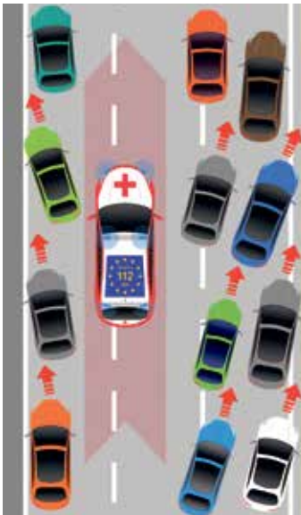
Rettungsgasse bei drei Fahrstreifen

Die Rettungsgasse darf ausschließlich nur von Polizei- und Hilfsfahrzeugen befahren werden. Allen anderen Kraftfahrern ist die Durchfahrt untersagt und wird bei Nichtbeachtung mit einem Bußgeld geahndet. Nichtbilden einer Ret-