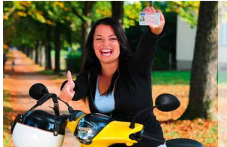
DEKRA gratulierte bereits millionenfach zum Führerschein

Bei allen Nachfragen wenden Sie sich bitte an Ihre DEKRA Niederlassung vor Ort – wir beraten Sie gern.